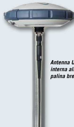
Antenna UHF interna alla palina brevettata